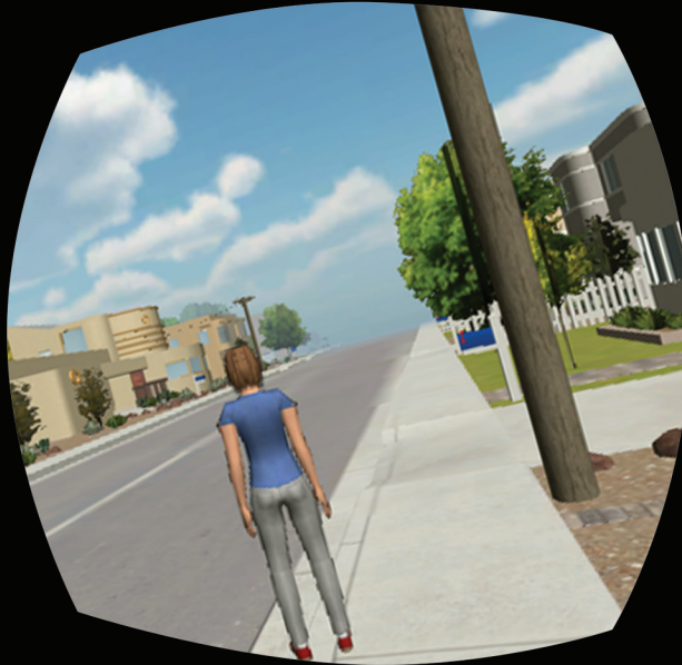
一般的头戴设备所使用的传感器 会造成画面歪曲和滞后