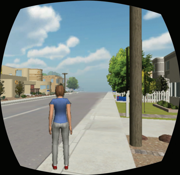
SpacePoint VR能准确的捕捉 人体头部运动